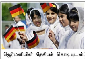
ஜெர்மனியின் தேசியக் கொடியுடன்!

நான் முஸ்லிமானபின் மன அமைதியை அனுபவிக்கிறனே. என மனைவி, இரு குழந்தகைகள், 80 வயதான தந்தை, ஏராளமான என உறவினர் ஆகிய அனைவரும் இப்போது முஸ்லிம்கள். ஒவ்வொரு நாளும் இஸ்லாத்தில் இணைவோரின எண்ணிக்கை கபடியவண்ணம் உள்ளது.