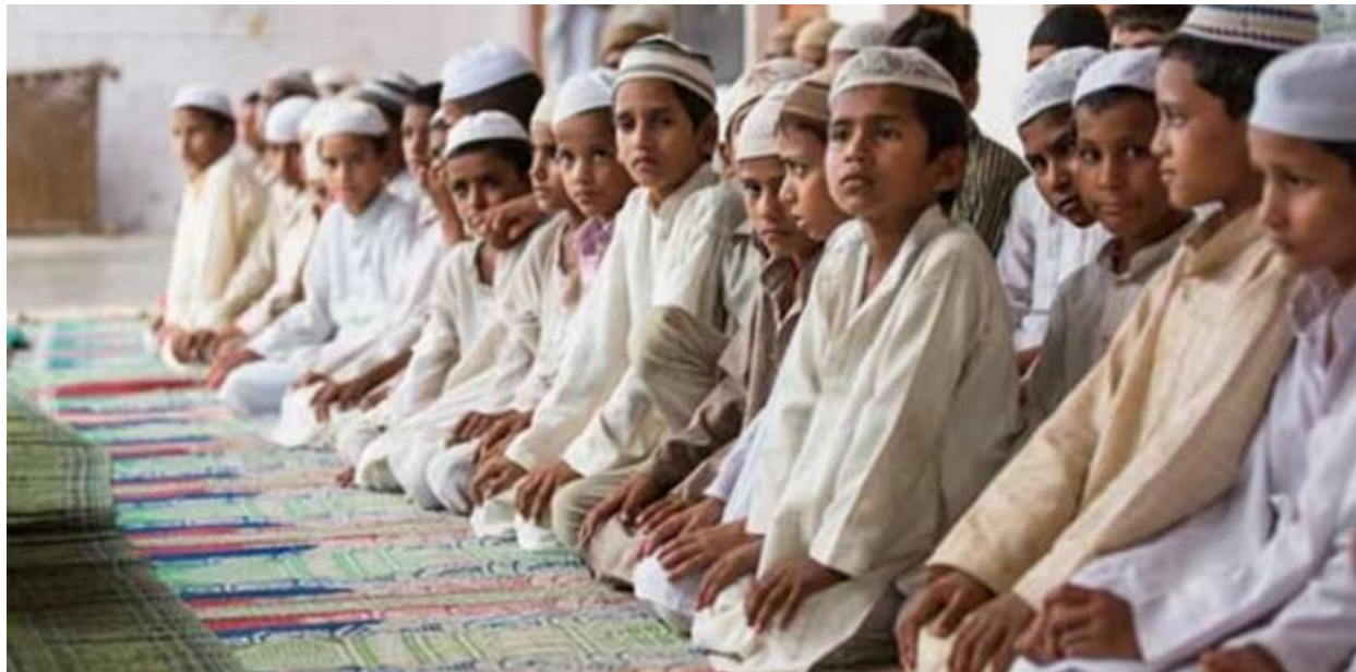
2014ல் ஏற்பட்ட ஆட்சி மாற்றத்தின் போது, நாட்டின் சமூக நிலையையும் முழுமையாக மாறியது. இன்று முஸ்லிம்களைப் பற்றிய விவாதங்களில், அவர்களின் பிள்ளைகள்

இஸ்லாமிய சமூகத்தின் வளர்ச்சி மற்றும் பாதுகாப்பு குறித்து குண்டு கமிட்டியின் அறிக்கையில் கருப்பாட்டது எதிர்காலத்தில் உண்மையானது. தனது அறிக்கையின் இறுதியில் குண்டு கமிட்டி இவ்வாறு குறிப்பிட்டு, "சிறுபான்மை இஸ்லாமியர்களின் வளர்ச்சியானது அவர்களின் பாதுகாப்பின் அடிப்படையில் இருக்கவேண்டும். சமூகத்தை துருவ முனைவாக கத்தை முடிவாகக் கொண்டுவரும் வகையில் தசீய அரசியல் உறுதிமொழிகளை அமல்படுத்தி அவர்களுக்கு நாம் நம்பிக்கை அளிக்கவேண்டும்". இந்த கணிப்பு உண்மை என்று நிரூபணமானது.